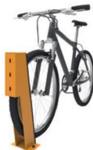
Optional mit zusätzlichem Fahrradständer